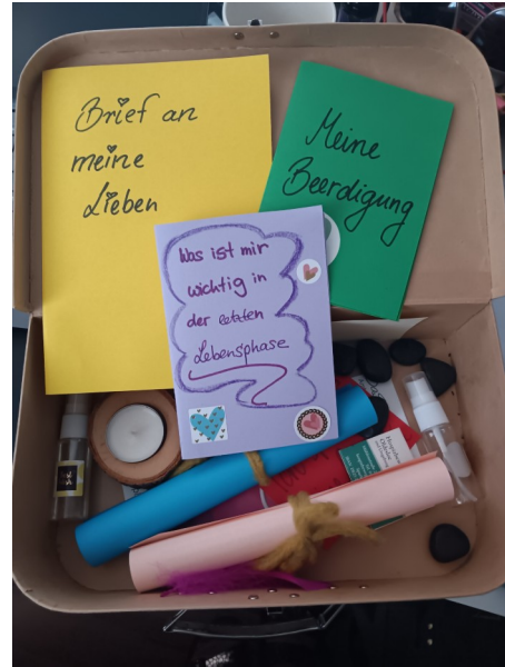
Arbeitskreise z.B. „wir gestalten den letzten Koffer“