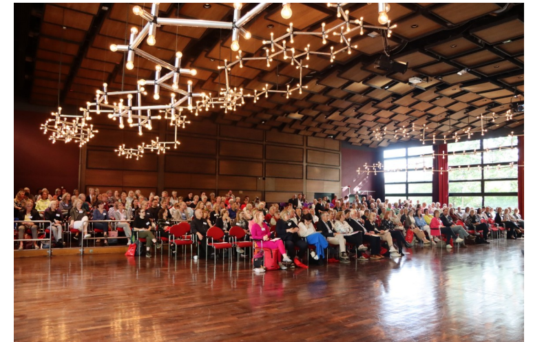
HupT in Bad Oldesloe