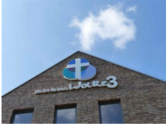
große Fortbildung Wolke 3 Thema: Basale Stimulation