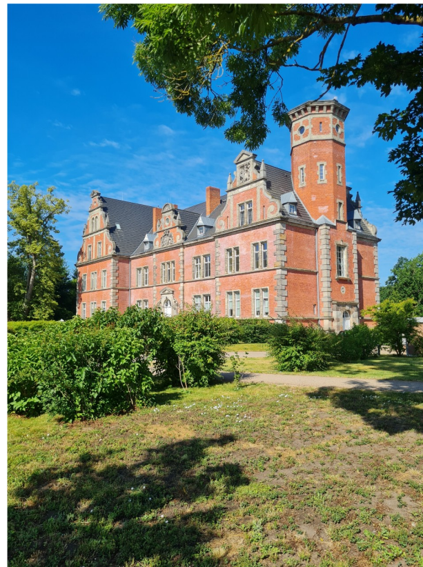
Palliativtag Schloss Bernsdorf