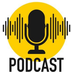
Podcasts sind entstanden zu den Themen: Kofferprojekt, Trauer am Arbeitsplatz, Essen und Trinken am Lebensende