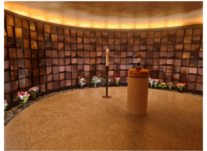
Besuch des Kolumbariums St. Marien-Dom in Hamburg