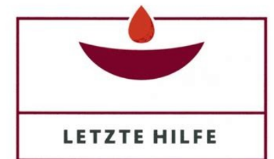
5 Letzte Hilfe Kurse