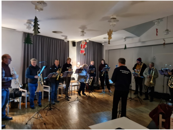
Lebendiger Advent im Bürgerhaus mit Posaunenchor