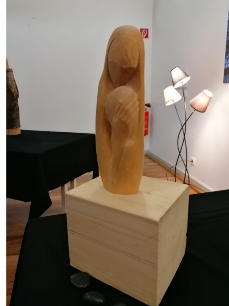
Vorträge im Café DaSein Themen: Trauer am Arbeitsplatz, Essen und Trinken am Lebensende, Vernissage „Skulpturen erzählen vom Leben“