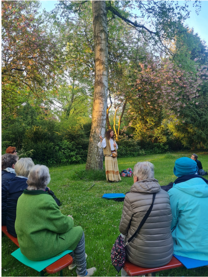
Märchenspaziergang auf dem Friedhof